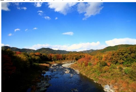
②金石水管橋より（360度パノラマビューがオススメ）